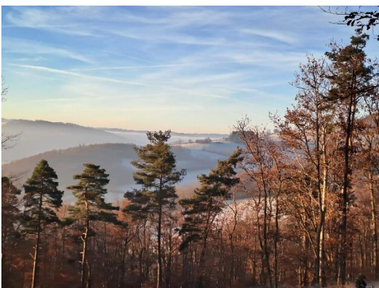
Route des crêtes – Monts du Lyonnais